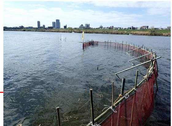
<多摩川下流に設置した定置網>