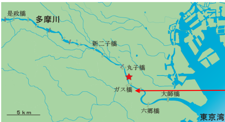
<調査地点（大田区下丸子4丁目付近）>